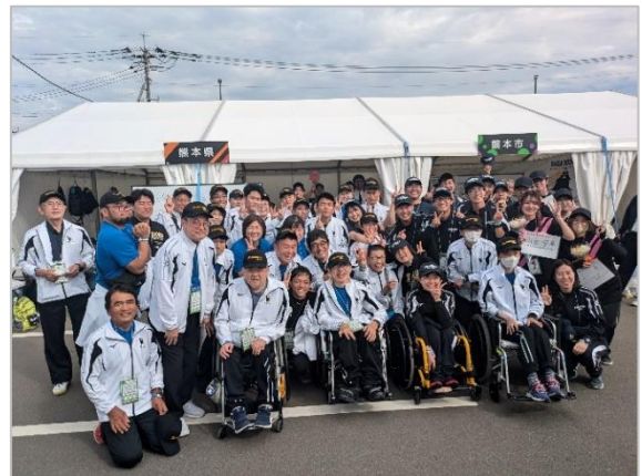
◆陸上 熊本県・熊本市