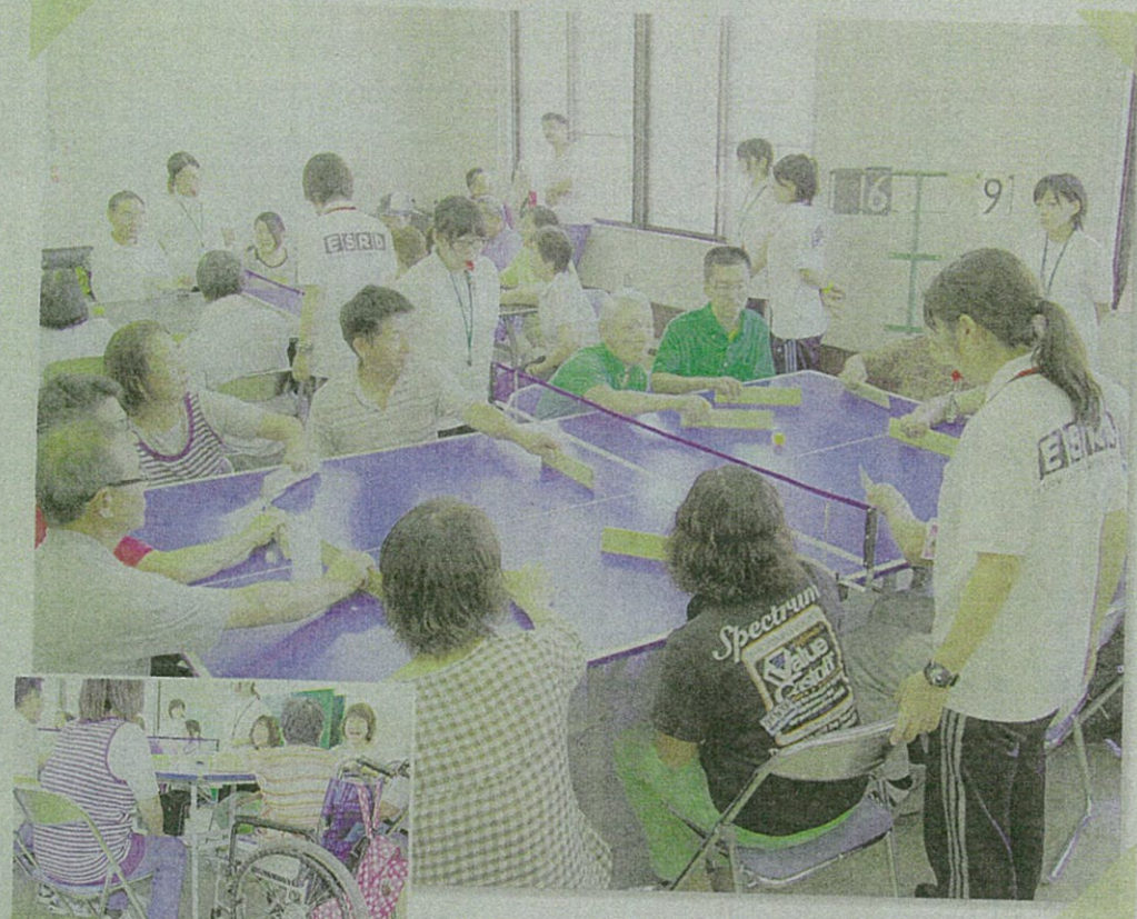
レベルアップを目指す3チームが集まった卓球バレーの練習会=佐賀市の県民運動推進センター