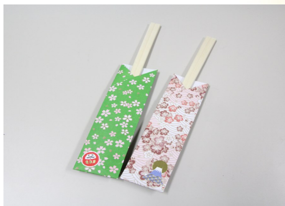
⑥ 飾りのシールを貼ったら完成!!