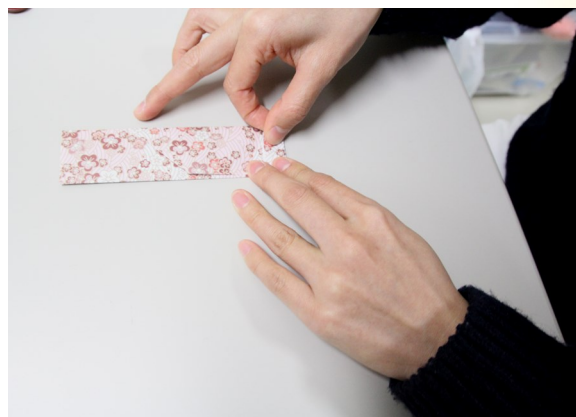
④ 右側の部分を中央に向かって折り、下の部分を折り曲げ、両面テープで留める。