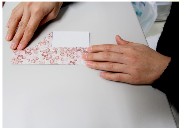
② ③で折った部分を右側に向かって折る。