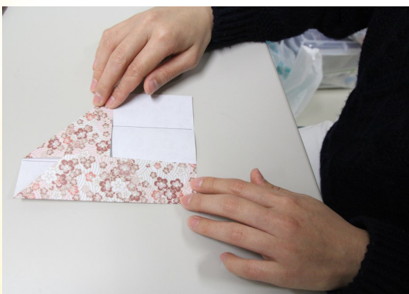
⑤ 左側の部分を中央に向かって折る。