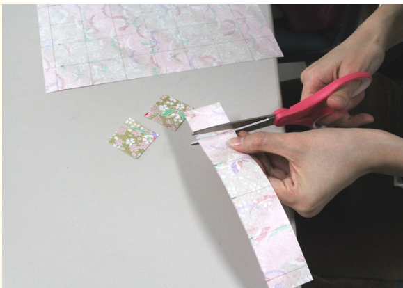
② 印通りにハサミで切る。