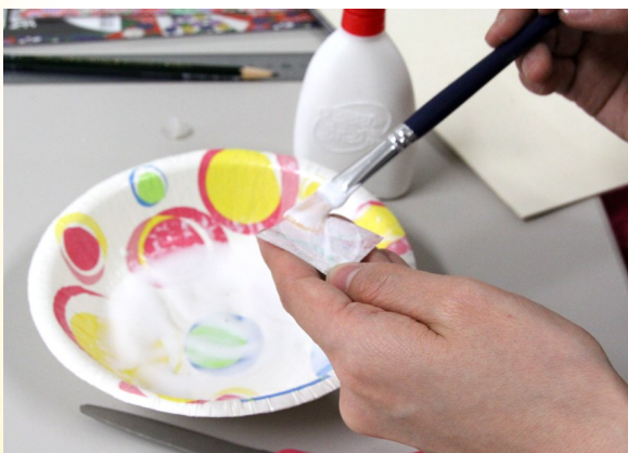
③ 和紙に水で薄めたボンドを塗る。