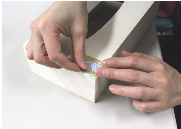
④ ティッシュボックスカバーに ボンドを塗った和紙を貼る。