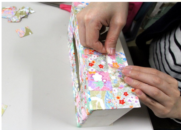
⑤ ③～④の工程を繰り返し、全面に貼る。