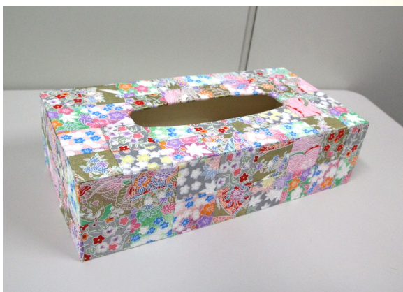
⑥ ボンドが完全に乾いたら完成!!