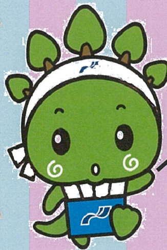
永原学園マスコットキャラクター ナカール