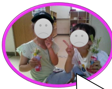
さんこう生け花教室—！！