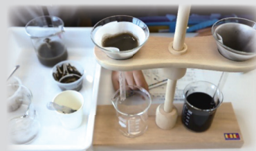
ミニ実験もします