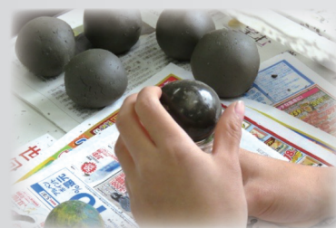
みがいていくと、光るんです