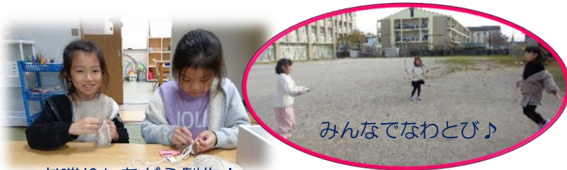
みんなでなわとび♪