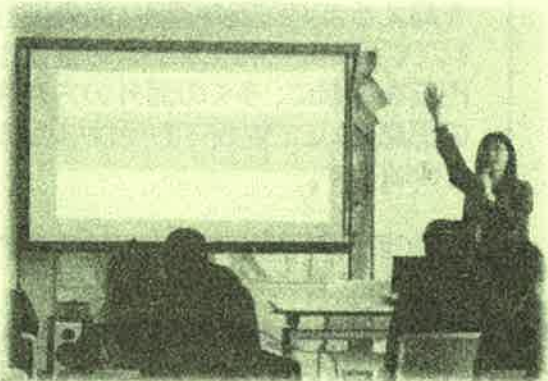
交通安全・防犯係の説明