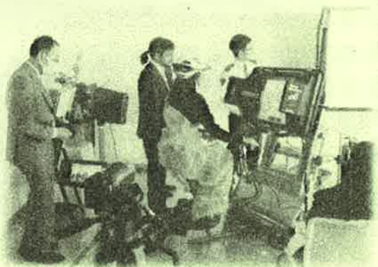
シミュレータ体験