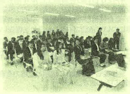
正装された参加者