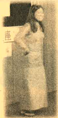
民族衣装でダンス披露

ミャンマーの国の紹介とダンス、ネパールの国の紹介と歌を2曲披露していただきました。普段触れることが少ない両国の情報や文化、内戦や洪水被害の現状を知ることができ、有意義な時間を過ごすことができました。