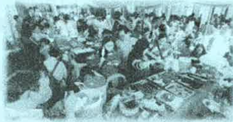
a. Acara Pengucapan

◆ひとこと: 佐賀県の公園や通り、特に佐賀城エリアと松原エリアの風景が面白いので、写真を撮るのが好きです。