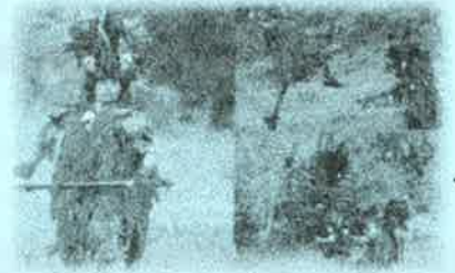
b. Kabasaran ダンス