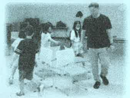
▯ 椅子取りゲームは大人気