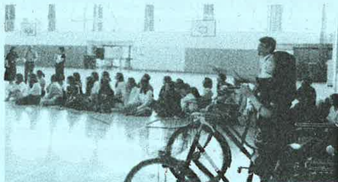
体育館での自転車指導