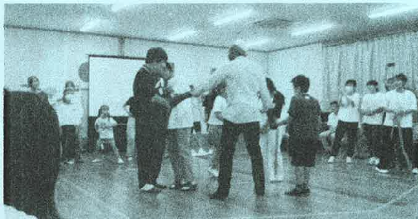
カメルーンのおにごっこを教わりました